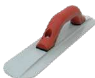
Platacho de Magnesio