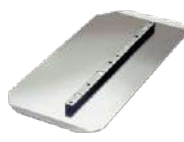
Aspa de combinación