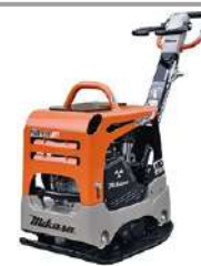
MQ Mikasa MCH128