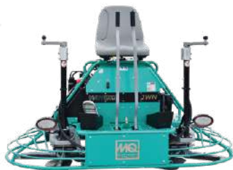
MQ Whiteman doble JWN-36