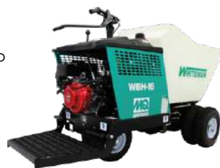
Multiquip Whiteman WBH-16