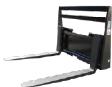
Porta Palet Edge PFS-48