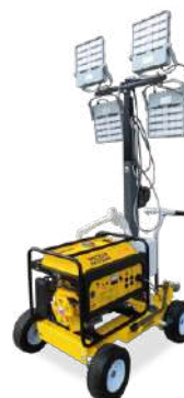
Wacker Nueson ML 440 Led