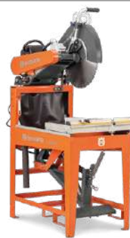
Husqvarna MS 610