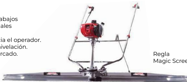
Regla Magic Scream