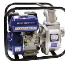
HYUNDAI HYDP50 / 2"

Las compresoras de Hyundi, cuenta con válvula de seguridad sobre-presión, la cual evita que los gases y el aire se acumulen en el interior y produzcan algún tipo de accidente.