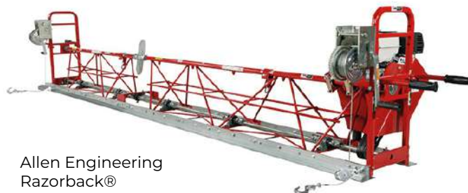
Allen Engineering Razorback®

Nuestras reglas reticuladas superan las expectativas del contratista para nivelado de pavimento y pisos industriales. Ideal para trabajos de vibrado de concreto para obras de pistas y vaciados masivos de hormigón. Con un largo de 3.80 - 19 mts