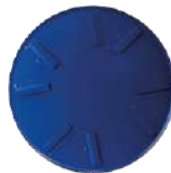
Plato de Flotación 36" - 46"