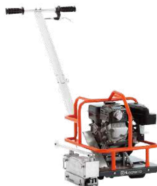
Husqvarna SOFF CUT 150