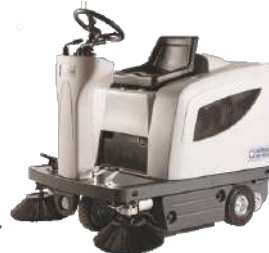
Nilfisk SR 1101