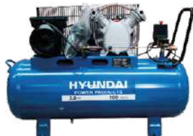
HYUNDAI HYHM100C / 115 psi / 100 Lt