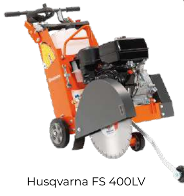
Husqvarna FS 400LV