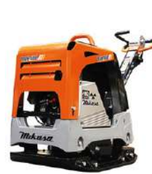
MQ Mikasa MVH408