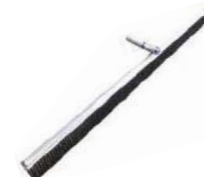
Escobillón para Textura