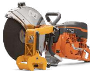
Husqvarna K1270 Riel