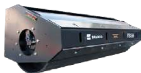
Rodillo Compactador Bradco VRS66