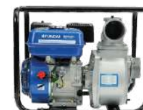
HYUNDAI HYDP80 / 3"