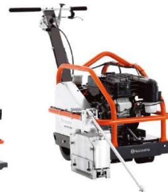
Husqvarna SOFF CUT 2000