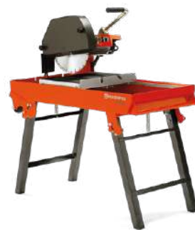
Husqvarna TS 350 E