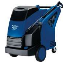
MH-6M FA (trifásica) Agua caliente