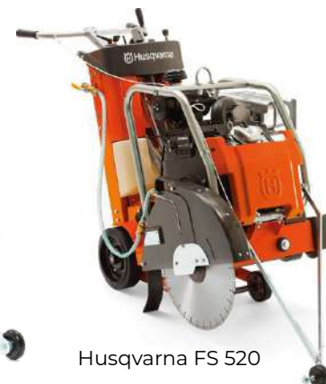
Husqvarna FS 520