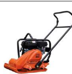
MQ Mikasa MCV88