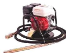
Vibrador gasoliner SENCI - Honda