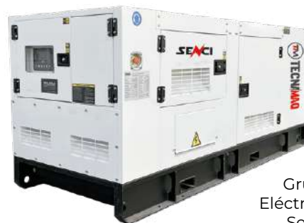
Grupo Eléctrogono Senci