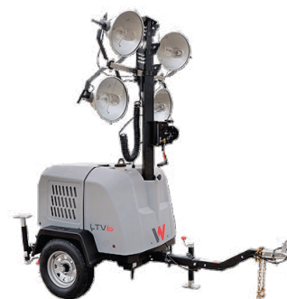
Wacker Nueson LTV 6L