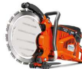
Husqvarna K970 Ring