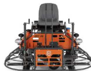
Husqvarna doble CRT-36