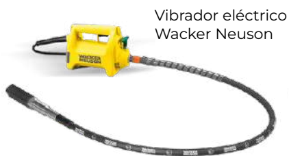
Vibrador eléctrico Wacker Neuson