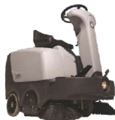
Nilfisk SR 1000