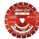
Disco Soff Cut