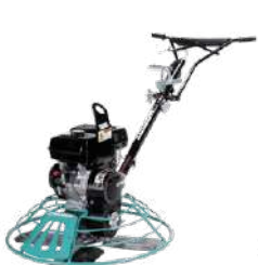
MQ Whiteman J36H90