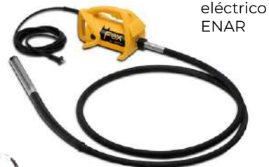
Vibrador eléctrico ENAR