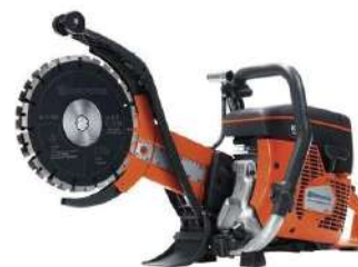
Husqvarna K760 CUT.N.BRAKE