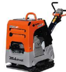
MQ Mikasa MVH508