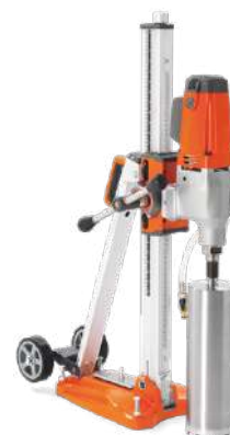
Husqvarna DMS 240