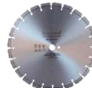
Disco de Corte