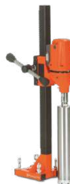
Husqvarna DMS 160