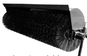
Barredora Angulable Martatch AB-72