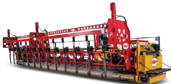
Allen Engineering TRTP255T4