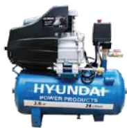
HYUNDAI HYHM24D / 115 psi / 24 Lt

Las compresoras de Hyundi, cuenta con válvula de seguridad sobre-presión, la cual evita que los gases y el aire se acumulen en el interior y produzcan algún tipo de accidente.