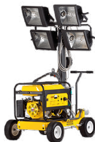
Wacker Nueson ML 440