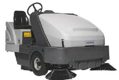
Nilfisk SR 1601